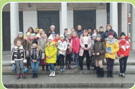
Budzów i Baczyn