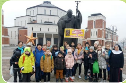
Mszana Dolna, par. Św. Michała Archanioła