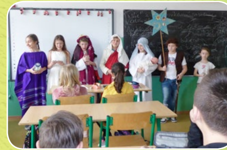
Kraków - Wróblowice