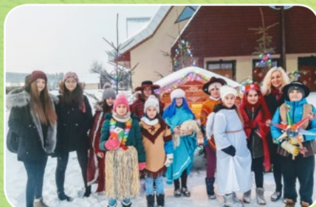
Nowy Targ, par. św. Jana Pawła II