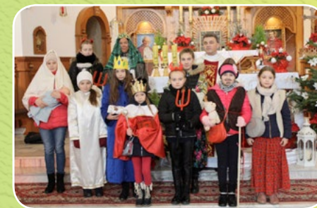
Jabłonka - Bory