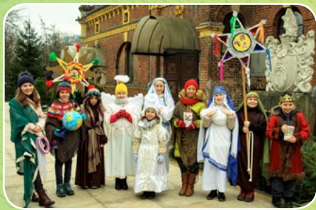
Kraków - Kaplica św. Mikołaja z Tolentino