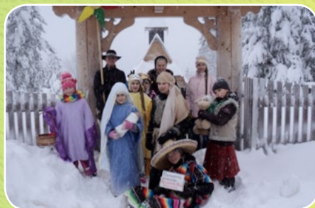
Zakopane, par. Najświętszej Rodziny