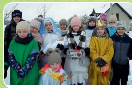
Jabłonka, par. Przemienienia Pańskiego