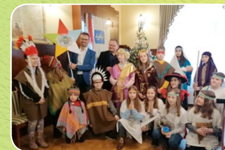
Skawina, par. ŚŚ. Szymona i Judy Tadeusza