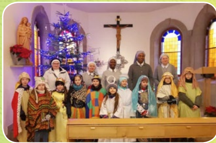
Kraków - Wola Justowska