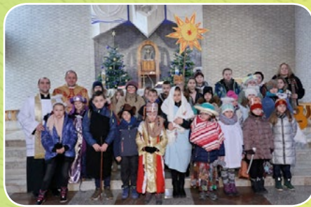
Kraków - Swoszowice