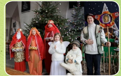
Kraków, Bronowice Małe, par. św. Antoniego