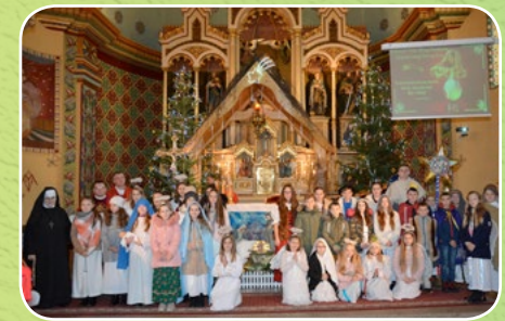
Lipnica Wielka, par. Św. Łukasza