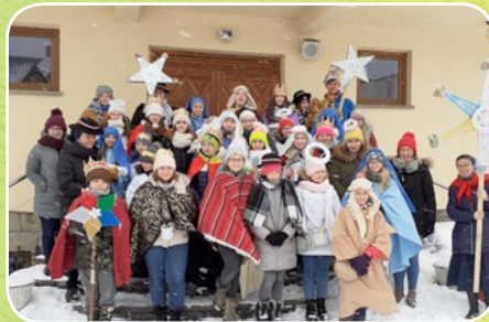
Nowy Targ, par. Św. Jadwigi Królowej