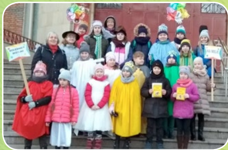
Kraków - Wieczysta, par. Matki Bożej Ostrobramskiej