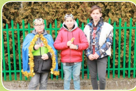
Kraków - Górka Kościelnicza