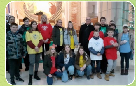
Kraków, Szkoła Podstawowa nr 82