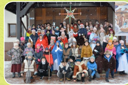
Lipnica Wielka - Murowanica