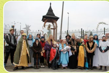
Kraków, par. Matki Bożej Dobrej Rady