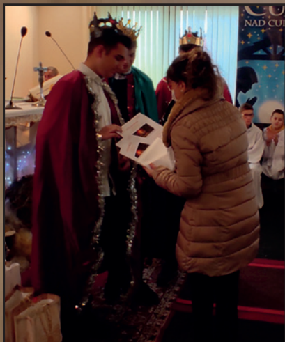
Parafia Narodzenia NMP w Harklowej - Knurów