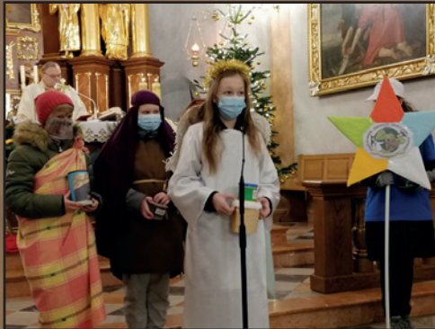
Skawina, Par. Świętych Apostołów Szymona i Judy Tadeusza