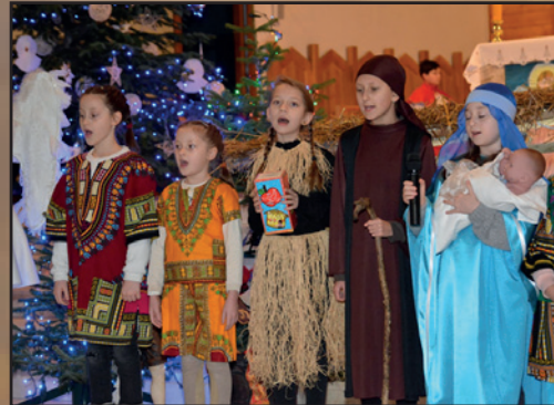
Nowy Targ, Par. św. Jana Pawła II