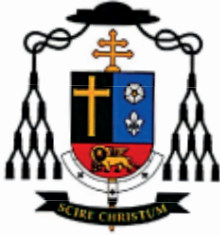
Arcybiskup Marek Jędraszewski Metropolita Krakowski

Drodzy Kolędnicy Misyjni, Opiekunowie, Katecheci i Animatorzy