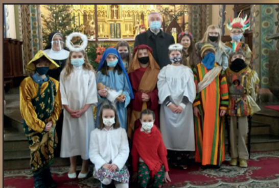
Mszana Dolna, par. św. Michała Archanioła