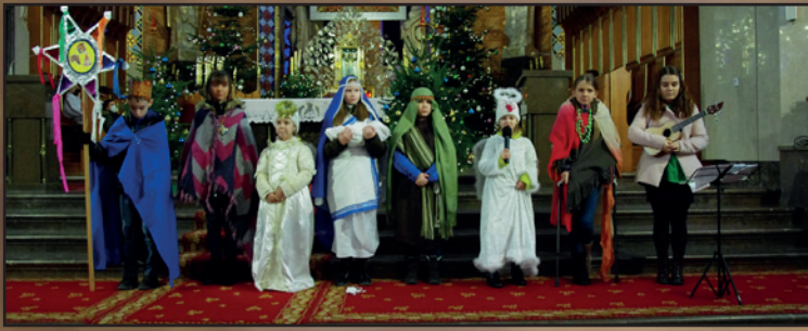
Kraków Prokocim Par. Matki Bożej Dobrej Rady