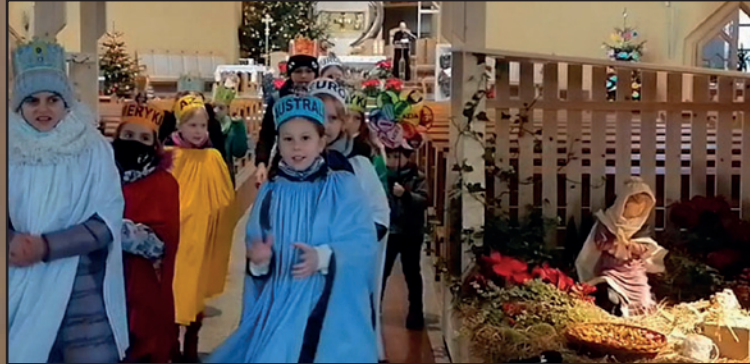
Kraków Par. Matki Bożej Ostrobramskiej