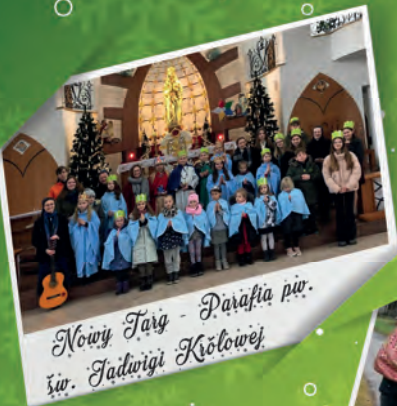
Nowy Targ - Parafia pw. św. Jadwigi Królowej