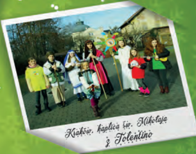
Kraków, kaplica św. Nikołaja i Toleńcin