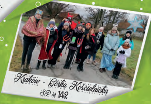
Kraków - Górka Kościelnicza SZ m 142