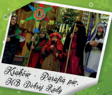
Kraków - Parafia pw. MB Dobrej Rady