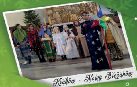
Kraków - Nowy Bieżanów