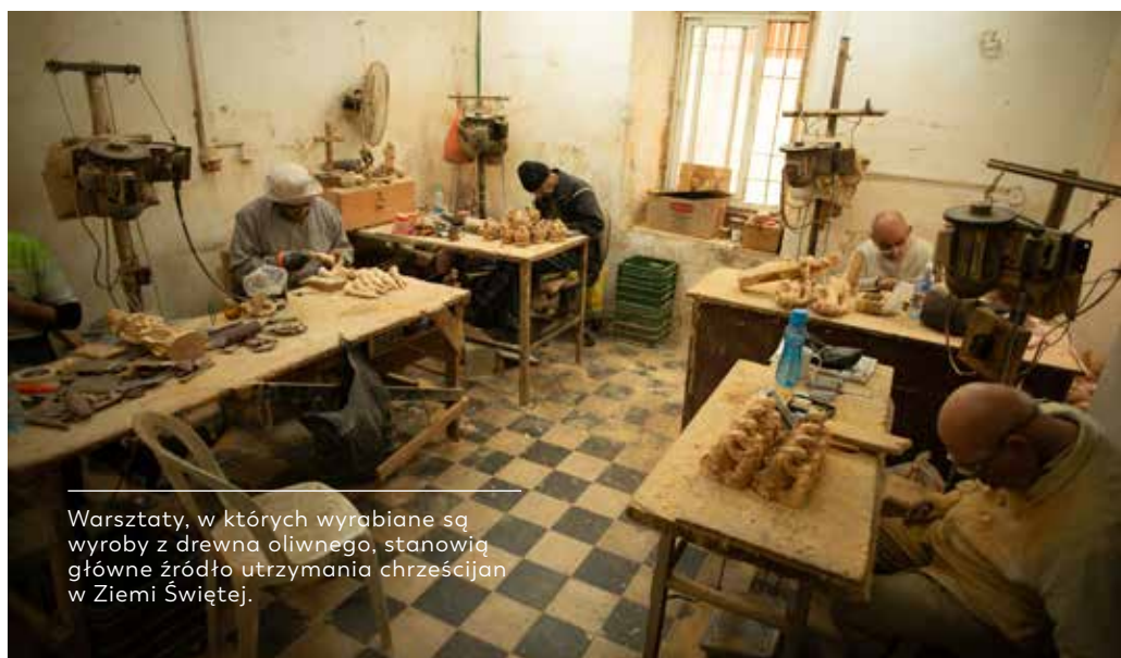
Warsztaty, w których wyrabiane są wyroby z drewna oliwnego, stanowią główne źródło utrzymania chrześcijan w Ziemi Świętej.