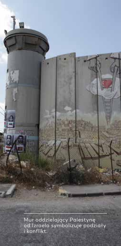
Mur oddzielający Palestynę od Izraela symbolizuje podziały i konflikt.