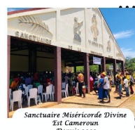
Sanctuaire Miséricorde Divine 2 e 1 Cameroun Depuis 2002