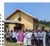
Chapelle Maison de formation/Ngoya Centre Cameroun Depuis 2010

Drodzy Współpracownicy i Przyjaciele naszej misji.